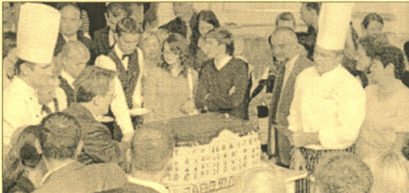
Na 94. urodzinach Polonia Palace gościło międzynarodowe towarzystwo, m.in. przedstawiciele Worldhotels.

Hotel Polonia Palace, należący do międzynarodowej grupy Worldhotels, 29 sierpnia 2007 roku świętował swoje 94. urodziny. Motywem przewodnim uroczystości było „Lato 1913”. Jako honorowego gościa hotel zaprosił swojego światowego partnera. – Cieszymy się, że mogliśmy zaprezentować nasze eleganckie wnętrza partnerom turystycznym i biznesowym właśnie wraz z Worldhotels. Nasza współpraca trwa już trzy lata i jest bardzo efektywna, głównie dzięki łatwemu dostępowi do wszelkich kanałów dystrybucji międzynarodowej oraz silnej